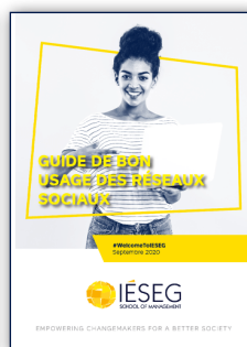
Guide du bon usage des réseaux sociaux

Retrouvez l'ensemble des guides et des médias de l'école sur le média center de l'IESEG