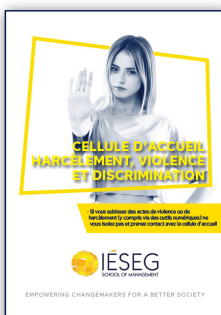
Guide de la Cellule d'accueil harcèlement, violence et discriminations